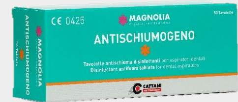
Pastillas antiespumogenas Código 1040826