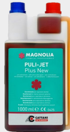
Puli-Jet Plus New Código 1060900