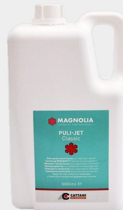
Puli-Jet Classic Código 1040715