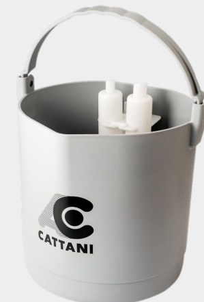
Pulse Cleaner Código 1040720